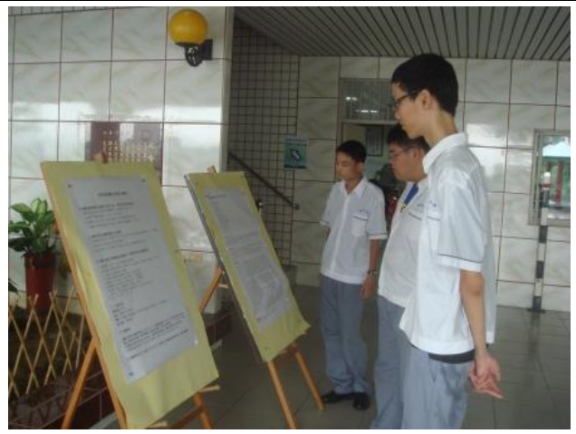
同學觀看競賽細節與得獎作品範例