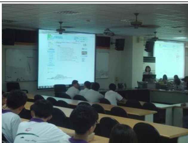
館長主講讀書心得研習